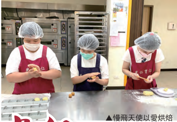
▲慢飛天使以愛烘焙