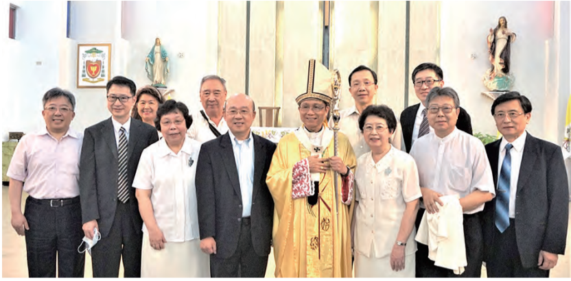
▲鍾總主教與耕莘醫療體系的貴賓們合影。▶鍾總主教與騎士、爵士們合影。