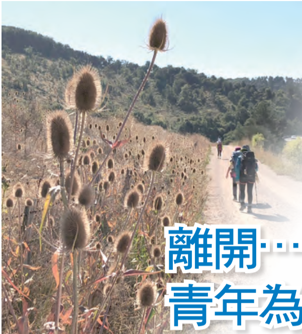
▲朝聖路上常見的景色