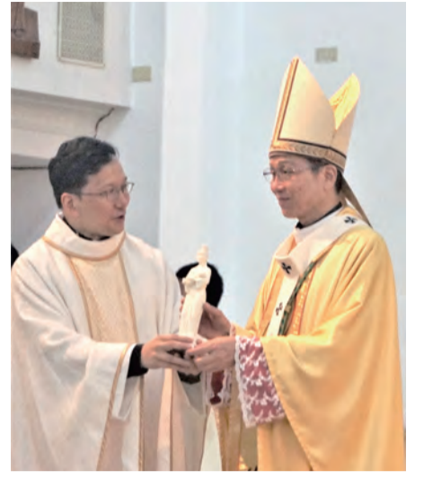
▲▲台灣天主教會歷史性的一刻！教廷代表首度在台灣本地授予台北總主教羊毛肩帶。