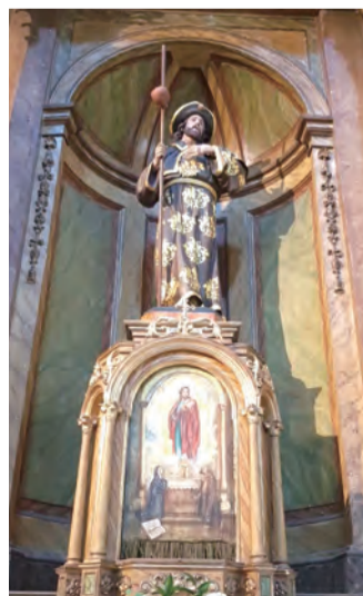
▲聖羅格的態像跟聖羅格神似，但祈禱意涵大不同。