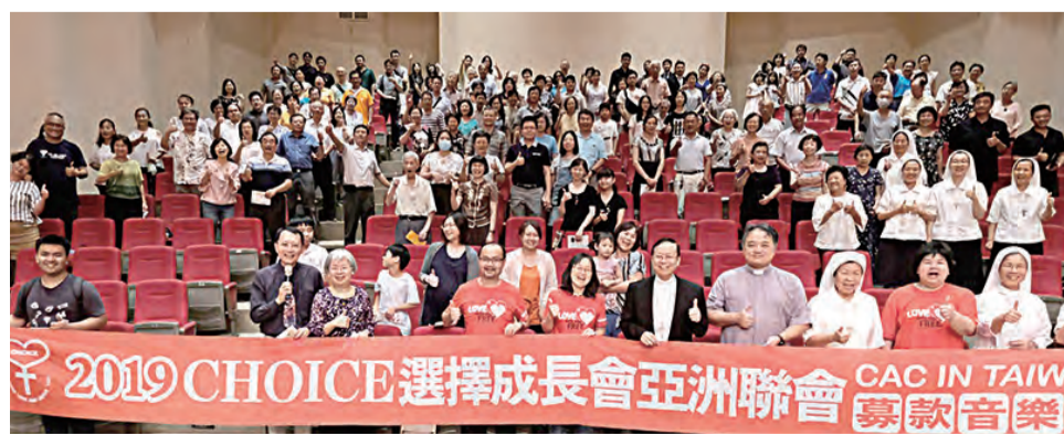
▲鍾安住主教親自出席2019年CHOICE選擇成長會亞洲聯會募款音樂會，喜樂共融。