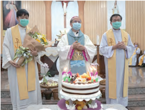
▲桃園總鐸區歡慶60周年暨李主教晉牧14周年