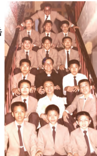
▲鍾院長與達義小修生