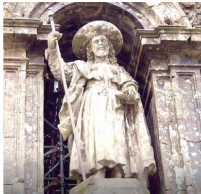
▲聖雅格大教堂建築外觀的聖雅格