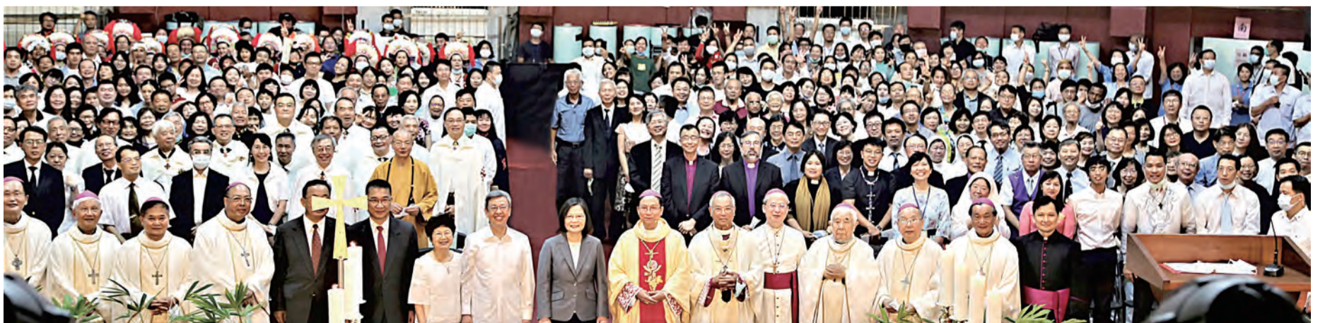
▲中華民國總統及政府首長、各宗教領袖及基督宗派代表等貴賓，參與台北總教區鍾安住總主教就職大典後，與神長及教友們歡喜合影。

所有為了台北總教區及整個台灣天主教會歷史上的這一重要里程碑而蒞臨現場的人，聖父對各位確保他親切和慈父般的關懷；因此，讓我們也記得經常為教宗方濟各祈禱。謝謝！