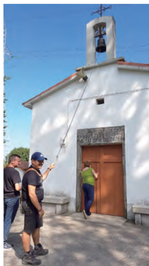
▲朝聖者喜歡在聖羅格教堂前鳴鐘，祈求帶來平安健康。