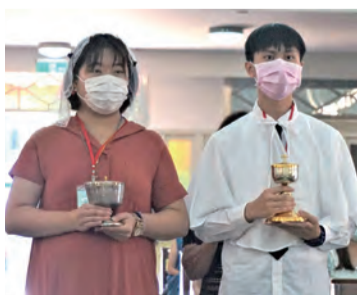
▲兩位新領洗教友代表，在首祭彌撒呈獻餅酒，意義重大。