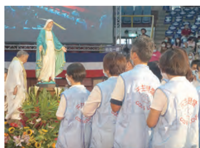
▲聖體服務志工訓練有素，讓近2000位參禮者有條不紊地依序地恭領聖體。