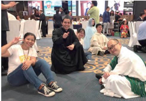
▲聖母、聖伯多祿、聖鮑思高、聖多瑪斯 Are you ready