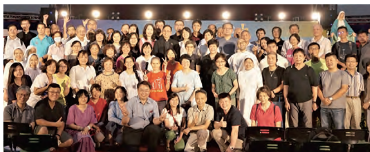
▲綵排之夜，鍾安住總主教特別來感謝工作人員，致贈祝福小卡。 ▲德來小妹妹會修女們負責大典花藝，巧思與祝福盡在其中。