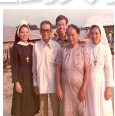
▲1977年小姊妹（左）發終身願