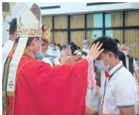
▲李克勉主教為領堅振的教友行覆手禮