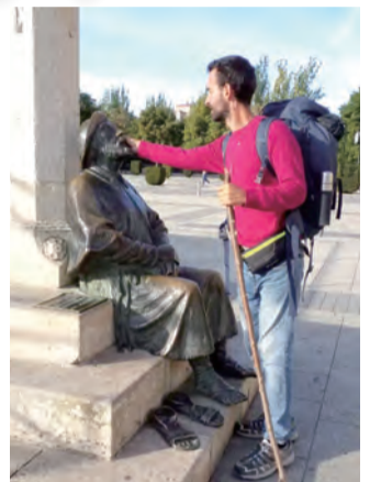
▲現代朝聖者與聖雅格雕像