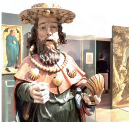
▲中世紀手持扇貝的聖雅格態像