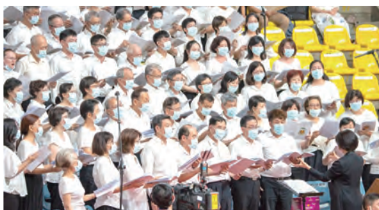
▲由歐遠帆教授指揮的百人聖詠團，在短時間內集結有專業素養的團員練唱新曲，使聖樂禮儀服務感動全場。