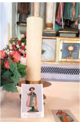
▲免疫主保聖羅格的祈禱卡在祭桌上，供人拿取祈禱。 ▶擦拭耶穌聖容的聖婦韋羅尼態像，也出現在Camino英國之路上。