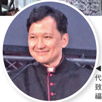
◀佳安道代辦幽默致詞，祝福深深。

可敬的中華民國蔡英文總統、台北總教區鍾安住總主教、台北總教區榮休洪山川總主教、新竹教區及台灣地區主教團主席李克勉主教及各教區主教們、尊敬的中央和地方政府長官與代表、基督教教派領袖和其他宗教領袖：台灣聖公會張員榮主教、中華基督教衛理公會龐君華會督、台灣基督長老教會總會議長Abus Takisvilainan牧師、普世幹事連振翔牧師、基督教台灣信義會高堂恩牧師、台灣聖經公會鄭正人牧師、中華正教會（莫斯科牧首座）愛西里爾神父及邱秉正秘書長、台灣基督教福利會董事長劉仁海牧師及執行長游宗仁長老、台灣基督教青年會協會YMCA李勝雄長老、中華民國基督教女青年會協會YWCA朱張蓓蒂牧師、勵馨社會福利事業基金會呂雪瑛傳道；以及中國佛教會、中華民國宗教與和平協進會理事長釋淨耀法師、中華民國宗教與和平協進會釋聖玄法師、天帝教總會黃德賢理事長、夫人黃詹玉真女士、天帝教總會暨中華民國宗教與和平協進會劉曉萍秘書長、伊斯蘭教初雅士會長、軒轅教陳國臺副宗伯及葉奇賢宗正、中華民國一貫道總會陳昭湘副秘書長、李耀和講師、簡鳳伶秘書、世界和平統一家庭聯合會陳拓環理事長、台灣耶穌基督後期聖徒教會台灣公共事務代表莊忠衛、天德聖教王明理事長；以及敬愛的神父們、男女修會會士、我在基督內親愛的弟兄姊妹們，大家好：