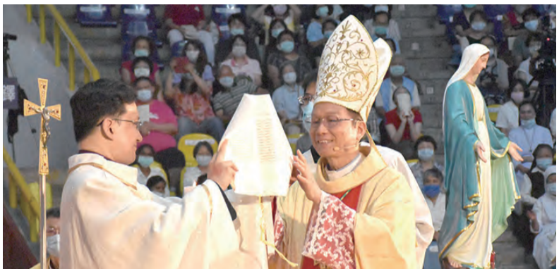
▲鍾總主教從教廷代辦手中接過任命詔書，並向聖職及信友們展示。