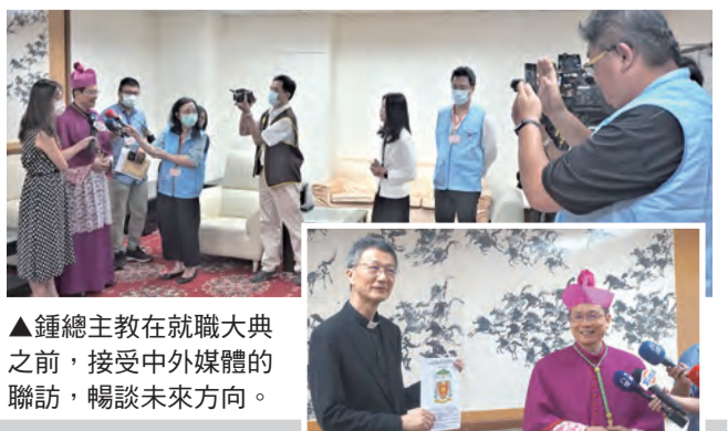
▲鍾總主教在就職大典之前，接受中外媒體的聯訪，暢談未來方向。