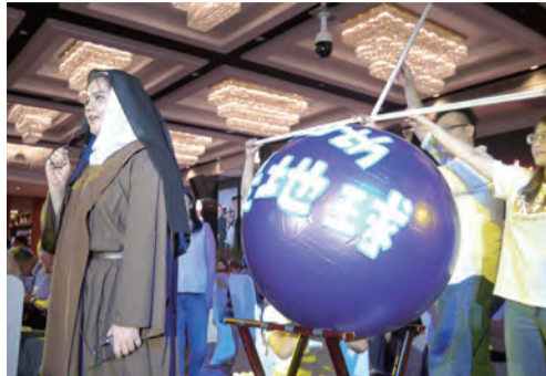
▲聖女小德蘭的分享祈禱為一根槓桿，天主為我們的支點，我們可以撐起整個世界。