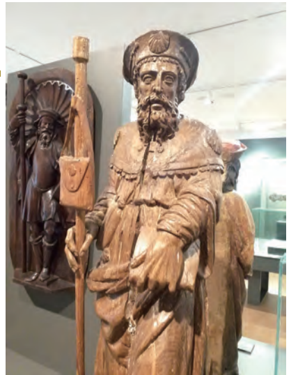
▲朝聖帽配戴扇貝的聖雅格