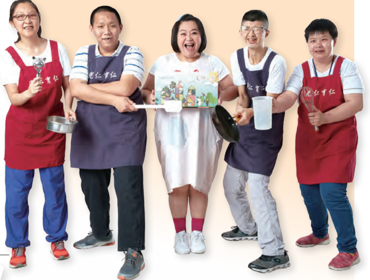
■文·圖/天主教光仁社會福利基金會