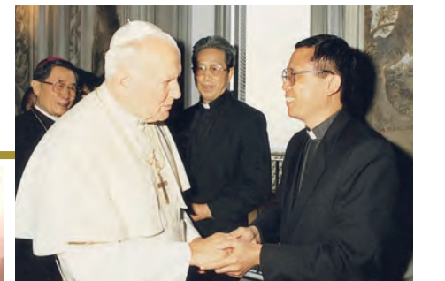
▲晉見教宗若望保祿二世，後為單攝機。