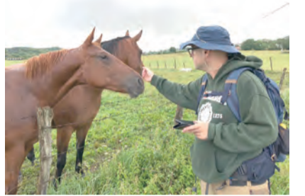
▲徒步路上遇到很多動物，馬是其中之一。 ◀攀上山頂後，朝聖者興奮合照。

那為什麼在青年這個階段要走出去呢？教宗方濟各在《生活的基督》宗座勸諭中提到：「青年期是發展人格的階段，其特點是夢想正在形成、人際關係更趨穩定平衡、喜歡嘗試和試驗，並須作出重要的選擇，以逐漸塑造其人生。在這個人生階段中，青年