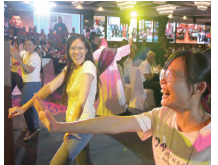
▲主是我喜樂，是我力量，在祢內我心有盼望。