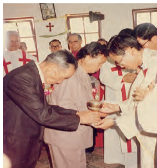
▲鍾神父從爸媽手中接過餅酒