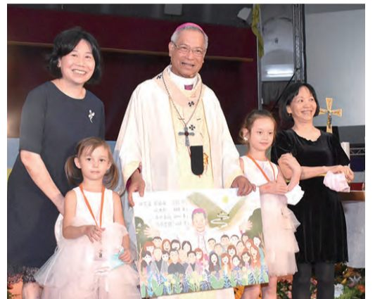
▲溫馨時刻！兩位小朋友向洪爺爺獻神花，表達台北總教區教友們的無限祝福與感激之情！ ▲鍾總主教致贈紀念品，感謝蔡英文總統蒞臨。

府也積極推動青年政策，希望教會和政府的共建平台，讓台灣的年輕人有更多發揮的機會，也為社會帶來更多進步和改變。