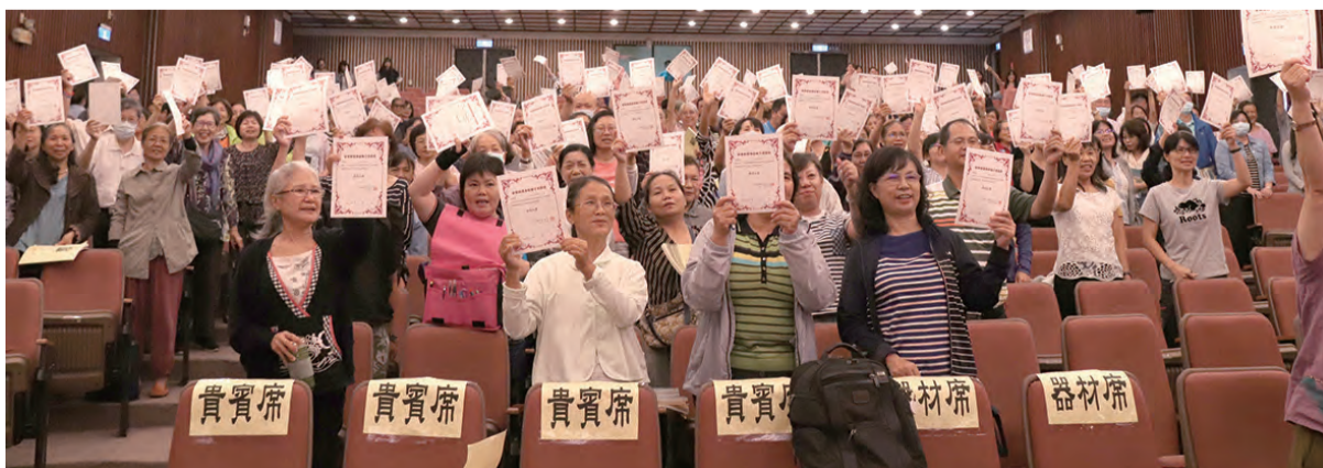
▲康泰基金會每年舉辦的安寧療護傳愛種子培訓班，參與學員充電百分百，滿載而歸。

「當癌症來敲門」精彩豐實的專題講座，台北場於8月22日（周六）在劍潭青年活動中心群英堂舉辦；高雄場於8月15日（周六）在蓮潭國際會館舉辦，歡迎大家踴躍參與，切實充電。