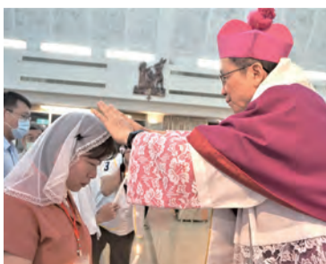
▲在聖洗聖事後，施行堅振聖事，鍾總主教為新教友行覆手禮。