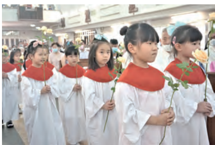
▲▲可愛的聖心幼兒園小天使們獻玫瑰花給聖母媽媽，並以純稚歌聲獻上祝福。