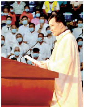
▲佳安道代辦宣讀詔書