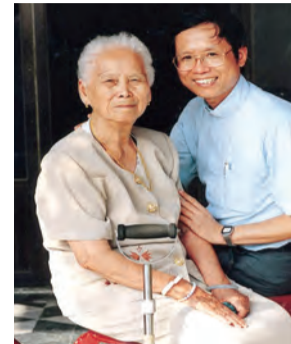
▲慈母念經與阿仔仔同修道