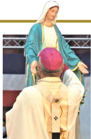
▲洪山川總主教向聖母獻香