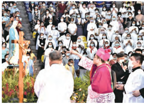
▲鍾總主教親吻十字苦架，並行灑聖水禮。