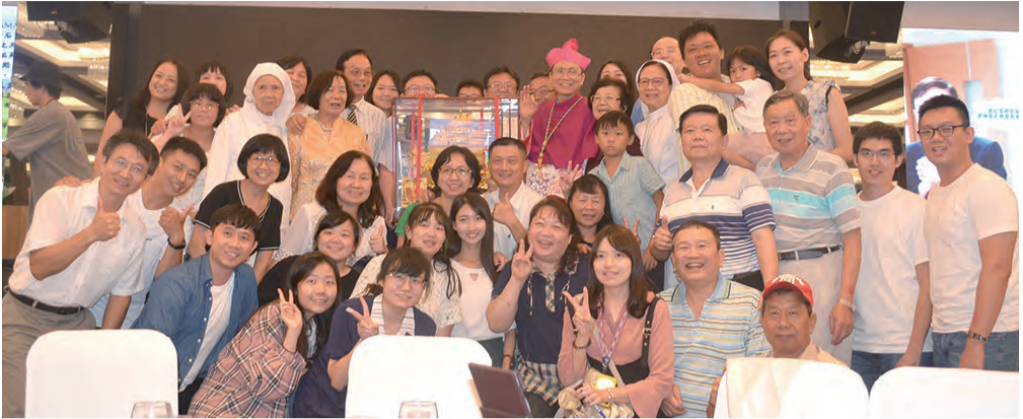
▲餐會之後，青年們相與鍾總主教開心合影。(林建修攝影)