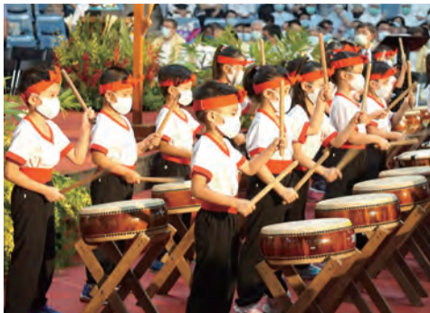
▲曉星幼兒園的小鼓手歡欣鼓舞敲出〈希望〉