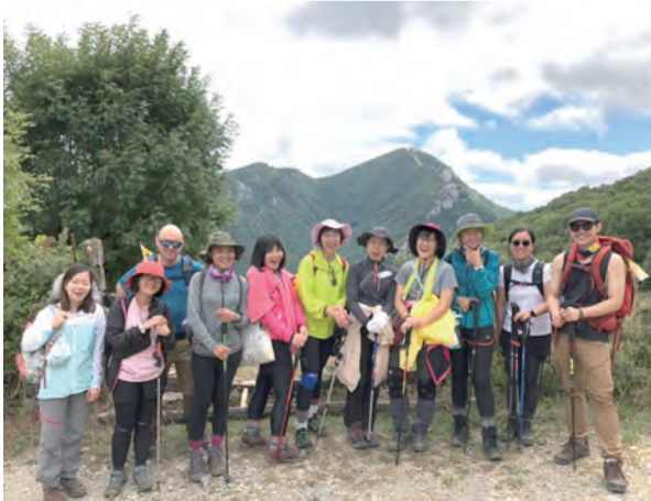
▲走過荊棘與泥濘，就快到達目的地了再堅持一下！