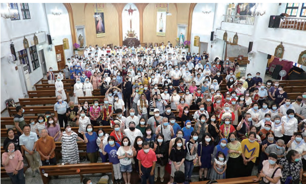
▲新竹教區在桃園總鐸區聖母聖心堂舉行禧年首場開幕禮，欣逢堂區主保日，喜上加喜，禮成後全體喜樂大合照。

孔子在《論語·為政篇》總結自己15歲到70歲的一生，稱60為「耳順」之年，有一解釋為：孔子60歲時因平日文化修養和獨立思考的操練，養成極強的聆聽能力，可與發言者心意相通；並且懂得「順天而行」。在慶祝成立60年之際，新竹教區感謝天主給予的無數恩典，同時也期許在聖神的引領下，全體天主子民能積極聆聽天主的教導（同道），共同遵行天主的旨意（偕行），承繼前輩主教、神父、修女、信友奠立的基業，發展福傳事工。