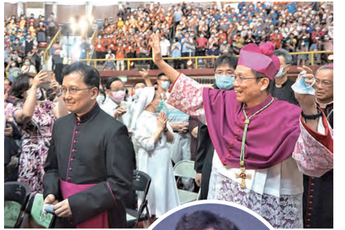
▲各宗教及基督宗派代表全程參禮，展現宗教交談的共融與合一。 ◀鍾安住總主教與教廷代辦佳安道蒙席，兄弟情誼，溢於言表。 ▶佳安道代辦陪同鍾安住總主教進場，全場歡聲雷動。