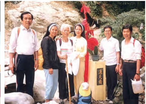
▲手足齊心帶85歲老母親登上聖母山莊感恩