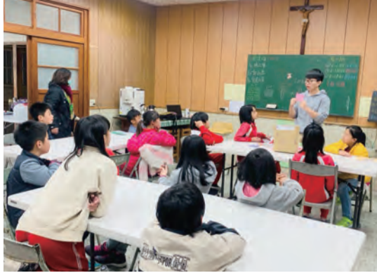
▲博幼基金會課輔班 ▶愛心大使鍾欣凌(中) 邀請大家攜手傳愛