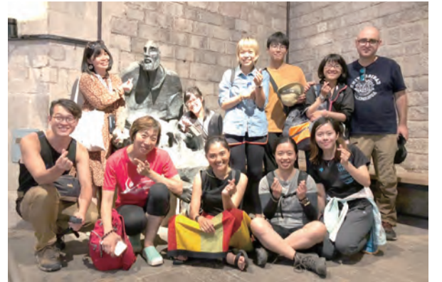
▲與巴塞隆納海洋聖母聖殿中，依納爵在此行乞的雕像合照。