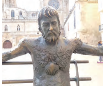
▲疲憊不堪的中世紀朝聖者雕塑 ▶最逗趣的聖雅格交通指揮像 ◀聖雅格宗徒棺槨