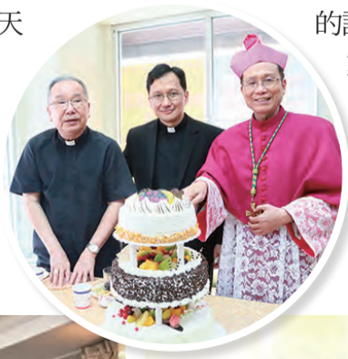
◀左起：宗座代表葉勝男總主教、教廷代辦佳安道蒙席、鍾安住總主教，一起切蛋糕慶祝就職後的首祭。 ▼彌撒後，各團體在主教座堂舉行共融感恩餐會，融樂一堂。

在鍾安住總主教首祭中，主座教堂慕道班呈現所結之果，慕道班的老師更積極地期盼8月底開始新的慕道班，慕道班老師更要與會者透過手機，以一指神功之力，將慕道班招生的訊息傳揚開來。這些勇敢傳愛的行動，讓人看到主教座堂正勇於邁出步伐，向新福傳新境前行。