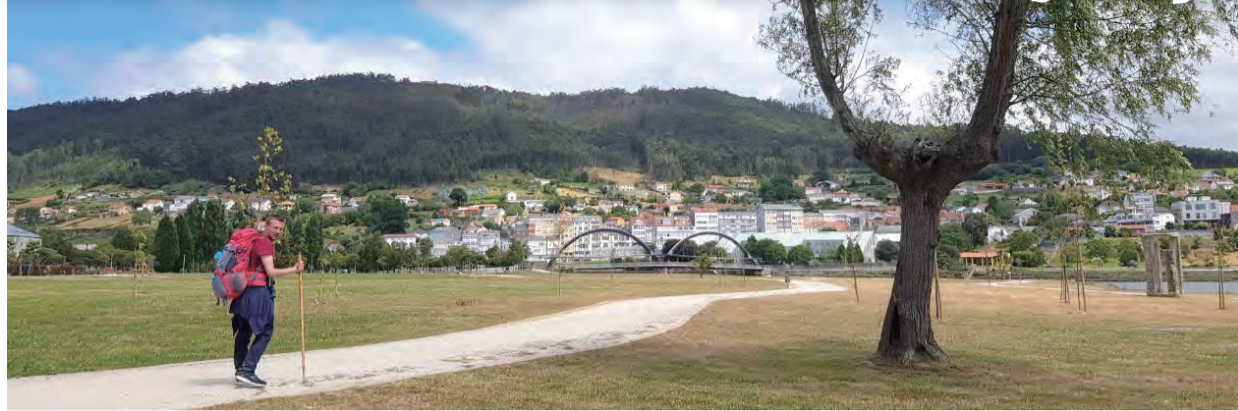
▲在美麗的Camino英國之路上，遇見來自英國的朝聖者。

夏日炎炎，感覺才剛過夏至，轉眼已進入小暑、大暑，隨著熱浪而至的景況，可以明顯地感受到，現在國人防疫新生活好像有點變弱了？