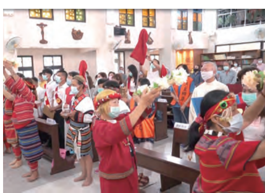
▲苗栗總鐸區邀請圓墩堂泰雅族教友表演奉獻舞