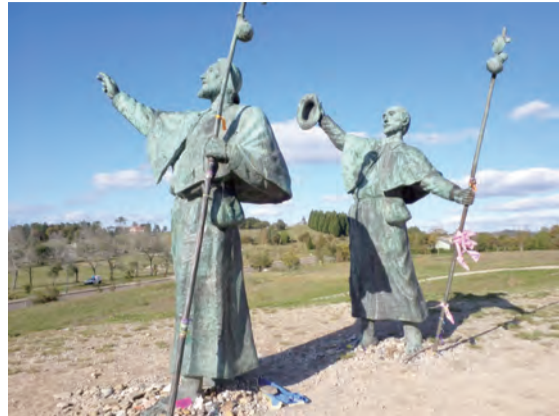
▲歡樂山的朝聖者大雕像