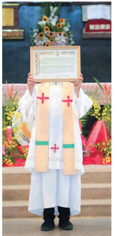
▲西新竹總鐸區的開幕禮中，頒賜全大赦時刻出示教廷獲准函。

新竹教區成立60周年（1961-2021），原訂於今年3月21日（周六）於新竹市聖母聖心主教座堂舉行禧年開幕禮，因新冠肺炎疫情，2月27日起全面暫停主日彌撒，開幕禮也取消。感謝天主施恩，於5月24日耶穌升天節恢復主日彌撒後，李克勉主教遂親自到各鐸區主持禧年開幕禮及舉行堅振聖事。