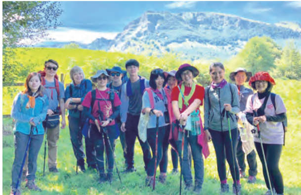
▲徒步朝聖的第一天