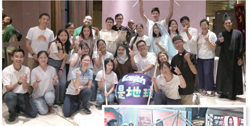
▲▶青年們齊心演出並祈禱