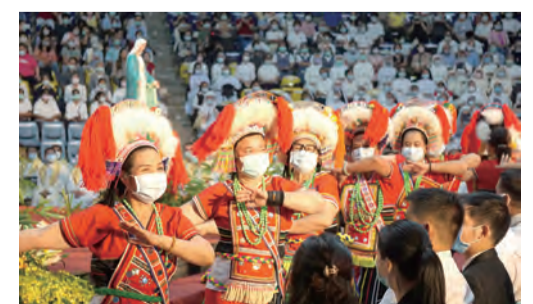
▲原住民朋友在奉獻禮中起舞，象徵美好共融。